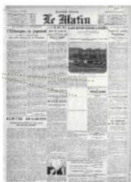
Le Matin, 3 décembre 1914, n°11948